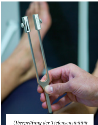
Überprüfung der Tiefensensibilität