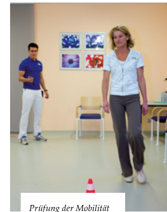
Prüfung der Mobilität