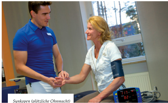
Synkopen (plötzliche Ohnmacht)